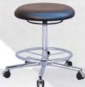
FORM PLUS HK