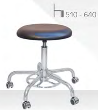
FORM HK FP