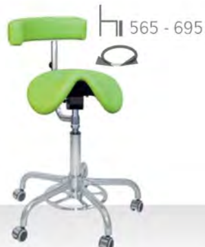
CLINE FP DENTAL