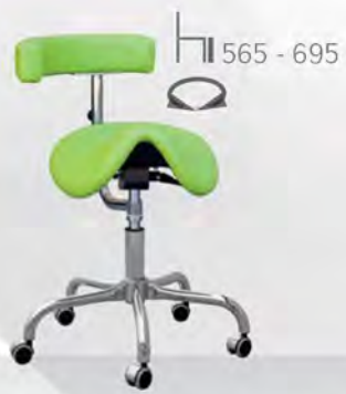
CLINE F DENTAL