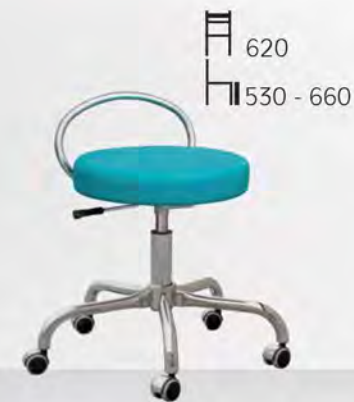
MONA II F