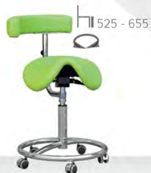
CLINE K DENTAL