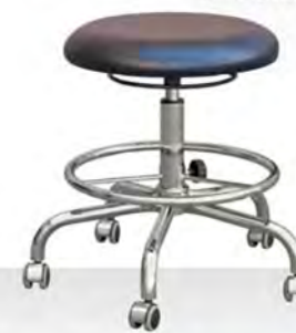
FORM HK FK