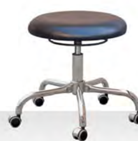
FORM HK F