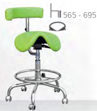
CLINE FK DENTAL