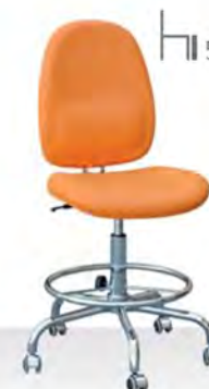
KOVONA PLUS F