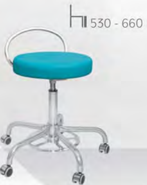
MONA II FP

KOVONAX spol. s r.o. Sušilova 477 768 61 Bystřice pod Hostýnem Česká republika | Czech republic