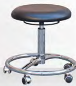
FORM HK K