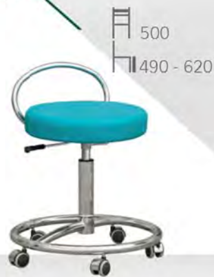
MONA II K